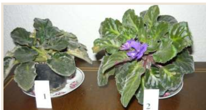
Рисунок 12. Комнатные фиалки.