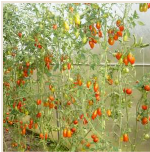
↑ Рисунок 5. Созревание томатов в теплице. Доза внесения удобрения 1500-2000 г/м 2 .

Аналогичные результаты получены и при выращивании салата на тепличном грунте (рис.6, табл.2.2). При внесении под перекопку 1500 - 2000 г/м 2 гранулированного конского навоза получен урожай сырой листостебельной биомассы в количестве 1,7 кг/м 2 , на контроле без удобрения 1,2 кг/м 2 . Растения, выращенные на удобренном фоне отличались насыщенной изумрудной зеленью,