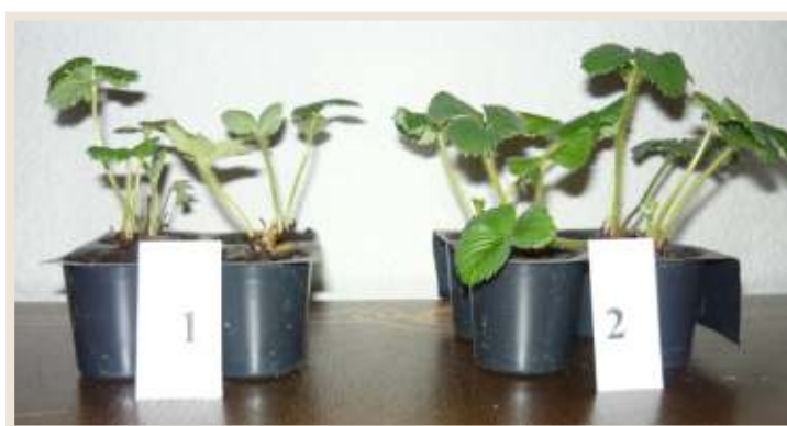
Рисунок 7. Рассада клубники. 1. контроль без удобрения; 2. доза удобрения 1 г/250 мл

Успех хорошего урожая земляники зависит от качества рассады высаживаемой на грядку. Лучше всего высаживать рассаду земляники выращенной в контейнерах или паллетах. Для этой цели использовали ёмкости объёмом 250 мл заполненные грунтом (смесь: 1 часть торфа + 1 часть дерновой земли), в каждую из них добавляли по 1 г (8,0 г/л) гранулированного конского навоза, высаживали кустики (усы) земляники с корнями длиной не менее 4 см, и хорошо проливали. Рассаду выращивали в течение 20 дней. Повторность опыта 5-и кратная. За это время она хорошо укоренилась, сформировала 2-3 хорошо развитых листа и имела здоровый вид. На контрольном варианте без удобрения рассада отставала в росте, была ослабленной и не пригодной к высадке в