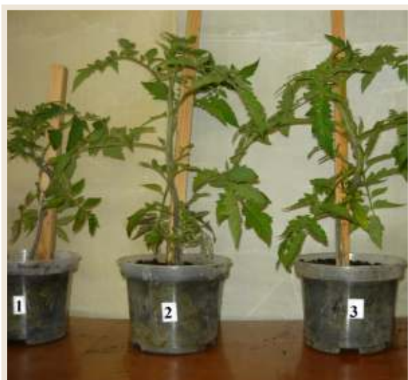
↑ Рисунок 2. Рассада томата. 1. контроль без удобрения; 2. доза 1,7 г/л; 3.- доза 2,0 г/л.