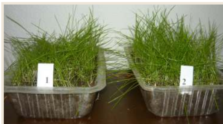
Рисунок 13. Газонные травы.

течение вегетации проводили 3 подкормки газонного травяного пласта. Подкормка способствовала быстрому отрастанию травостоя и придания ему ярко-зелёной окраски. Гранулированное органическое удобрение «ФРУ – ФРУ» можно использовать при формировании газонов любого