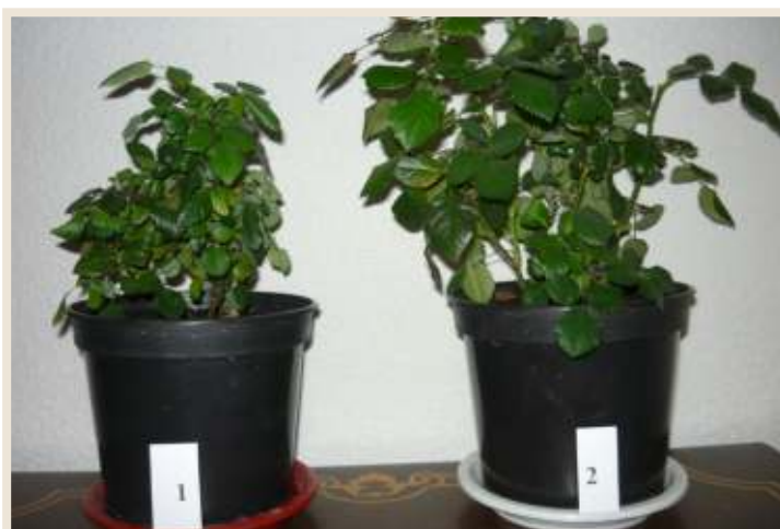
Рисунок 10. Вегетирующие розы. 1. контроль без удобрения; 2. доза удобрения 8,0 г/л + подкормки.

Растения, выросшие на фоне с внесением удобрений и подкормок опережали в развитии контрольный вариант, отличались высокорослостью (карликовые розы 25-35 см, парковые 55-60 см) яркой изумрудной зеленью, длительным цветением и более крупными цветками. На контрольном варианте растения отставали в росте, были на 10-12 см ниже ростом, цветки не крупные, быстро