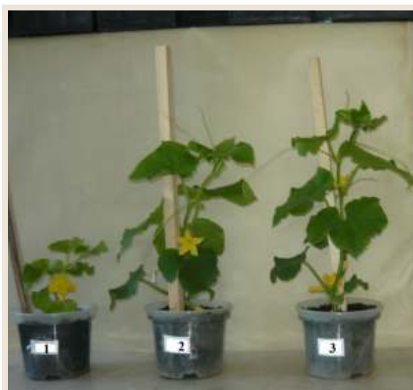
↑ Рисунок 3. Рассада огурца. 1. контроль без удобрения; 2. доза удобрения 6,0 г/л; 3. доза удобрения 7,0 г/л.