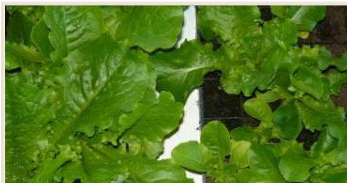
Рисунок 5. Биомасса салата.