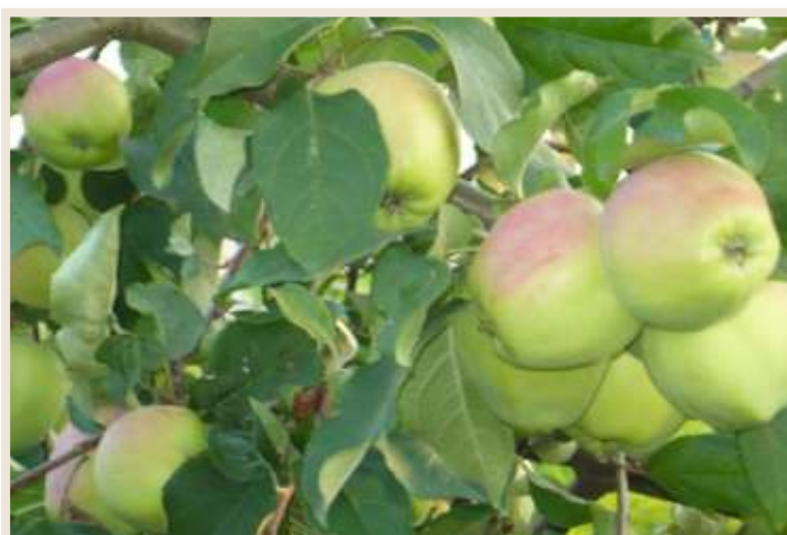
Рисунок 9. Плодоносящая 4-х летняя яблоня. Доза внесения удобрения 1500 г/ на посадочную яму при посадке + ежегодные жидкие подкормки.

При использовании данной технологии на деревьях отмечался активный прирост побегов, до 2,5 – 3,0 см/сутки, на контроле без внесения удобрения всего 1,0 – 1,5 см/сутки. Деревья и кустарники отличались ярко-зелёной насыщенной окраской листьев, ранним цветением