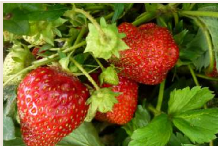
Рисунок 8. Плодоносящий куст клубники. Доза внесения удобрения 1500 г/м 2 под перекопку грунта + подкормки.